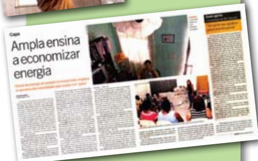
Consciência Ampla no caderno Razão Social do jornal O Globo