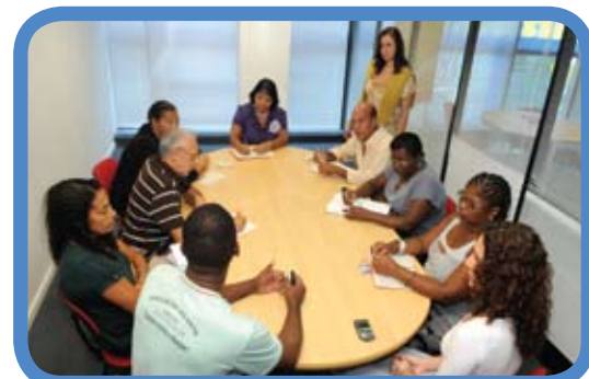
Reunião com os representantes da rede de líderes comunitários na sede da Ampla em Niterói

Na opinião dos líderes, mais difícil seria a companhia conquistar a confiança em lugares onde o furto de energia, o “gato”, chegava a quase